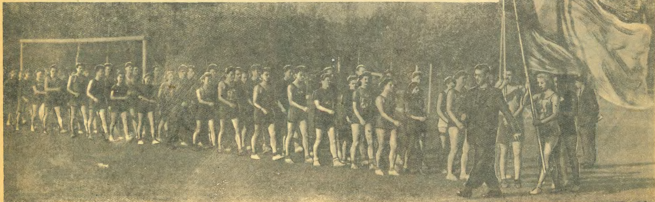
VII осенняя спартакиада МИСИ. Парад участников спартакиады на стадионе «Юных пионеров».